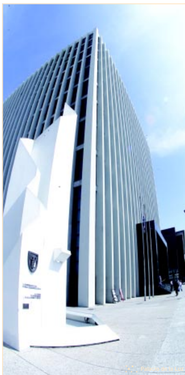
Palacio de la Luz

■ El valor del Tc (tiempo total de interrupción por cliente) registrado en el 2004, consagra a este año como el mejor desde el punto de vista de la calidad del servicio.